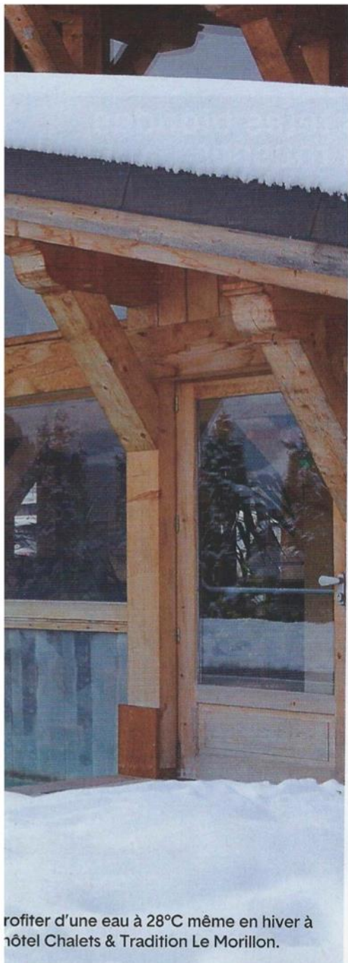
Profiter d'une eau à 28°C même en hiver à l'hôtel Chalets & Tradition Le Morillon.

Tradition pour la prestation bien-être que proposent la plupart d'entre eux, piscine, massages, soins, sauna, jacuzzi, fitness... Dernier en date : le Crychar ouvre cet hiver un spa design avec un bassin ludique qui ouvre sur l'extérieur équipé de différents points de massage et d'un couloir de nage. Le spa est également doté d'un espace détente (hammam, sauna, douche sensorielle, fontaine à glace, salles de sport, de massages et de repos).