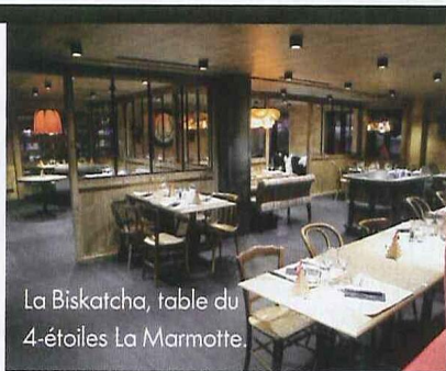
La Biskatcha, table du 4-étoiles La Marmotte.