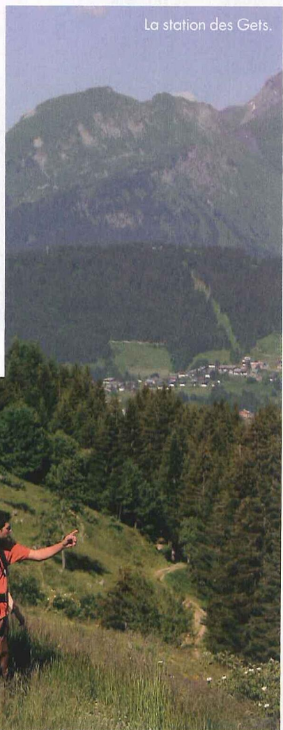
La station des Gets.