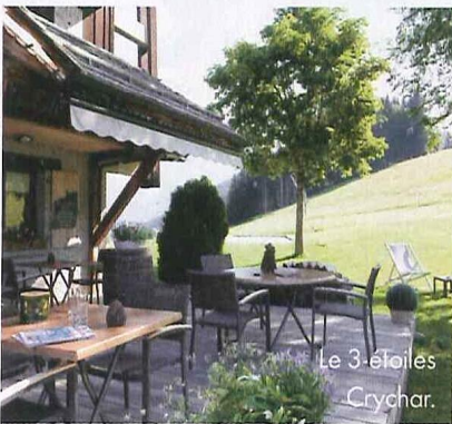
Le 3-étoiles Crychar.