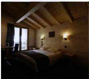
Hôtel Le Crêt, à Morzine.