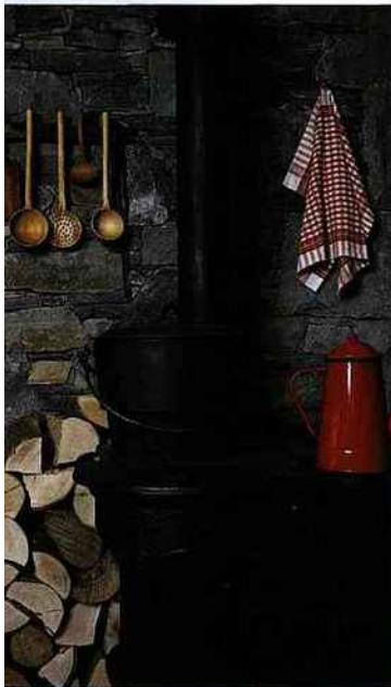
L'Alpage, à Morzine.

À La Fruitière L'Alpage, goûtez à l'authenticité d'une vraie ferme d'autrefois. Au sous-sol, la salle