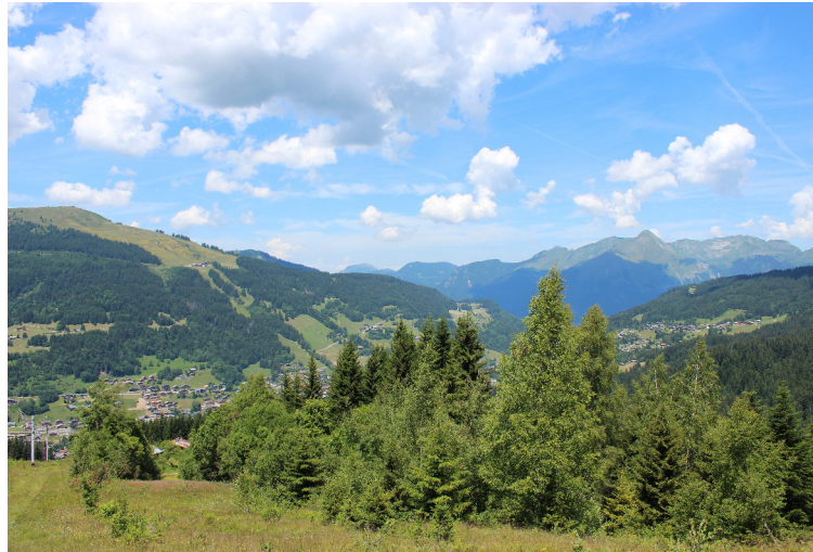
En descendant le versant de La Turche, on découvre la station des Gets nichée dans la vallée.

Niché au pied du col des Gets, point stratégique pour passer de la vallée d'Aulps à celle de Taninges, le village des Gets a su trouver sa place au cœur du grand domaine skiable des Portes du Soleil, près des célèbres stations de Morzine et Avoriaz.