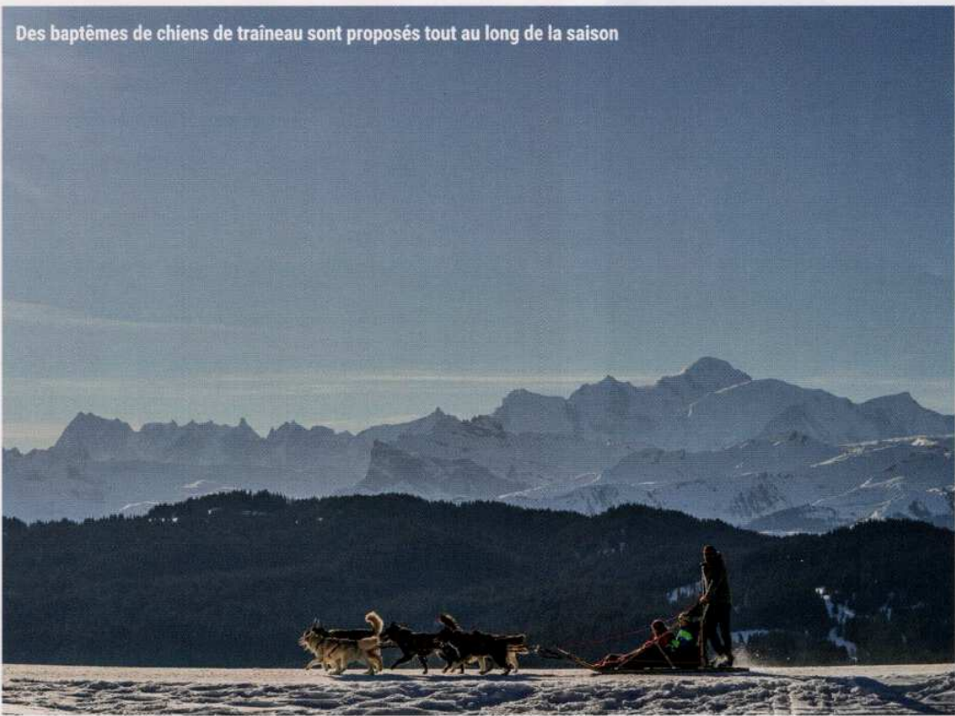
Des baptêmes de chiens de traîneau sont proposés tout au long de la saison