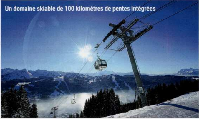
Un domaine skiable de 100 kilomètres de pentes intégrées

Il faudra se frayer un chemin entre les fêrus de paradis "instagrammables" et leurs perches métalliques. Désormais incontournable dans toute station d'hiver qui se respecte, le pas dans le vide permet d'apprécier la grandeur des panoramas alpins. Celui des Gets inspire particulièrement la contemplation, face à la chaîne du Mont-Blanc. Une pause revigorante en haut du télésiège du Ranfouilly sur cette plateforme de 27 m 2 surplombant le lac de Joux-Plane. Le rêve de tenir le toit de l'Europe dans sa rétine... et entre ses doigts grâce au système de photo automatique installé sur place.